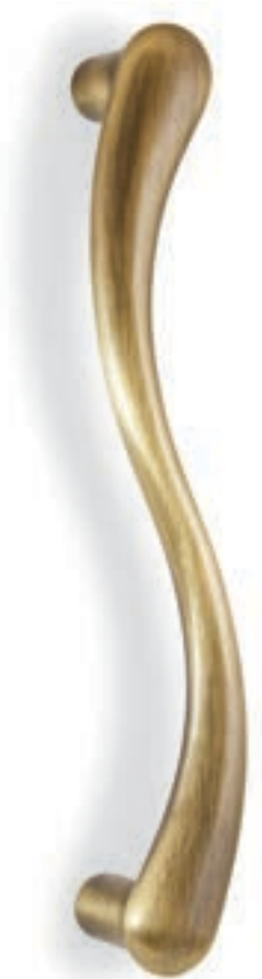
MG16S 240 06