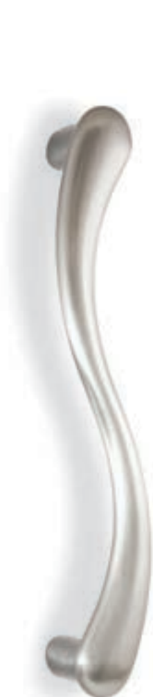
MG16S 240 03