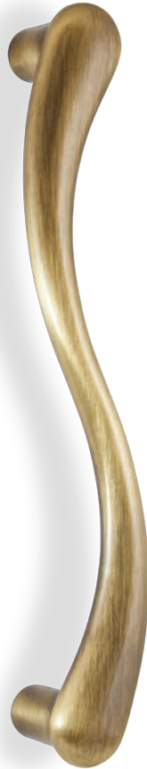
MG16S 240 06