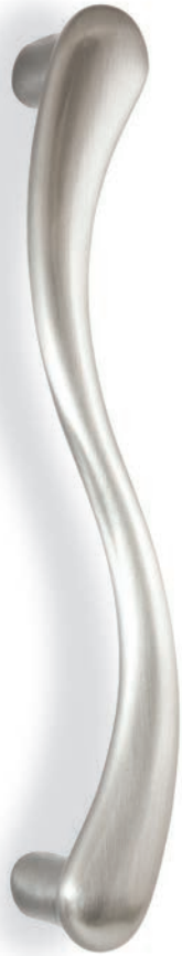
MG16S 240 03