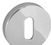
.1152 BP 02