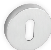
.1152 BP 21