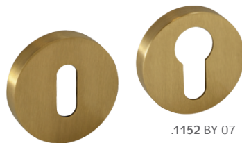
.1152 BP 07