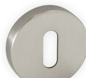
.1152 BP 03