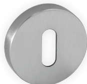
.1152 BP 13