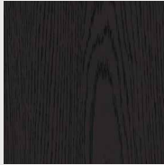
154 אלון שחור