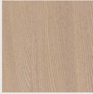
172 אלון מולבן