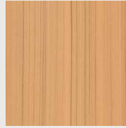
174 אשה שטרייף

* להזמנה מיוחדת של לוחות בטקסטורה ובגוון אשר לא קיימים במלאי - פנו לסוכן לבידור זמן אספקה מחו"ל.