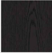
154 אלון שחור