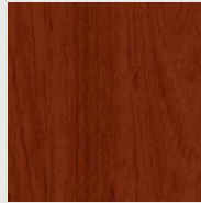
5660 אגס קוניאק