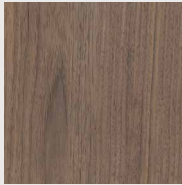
152 אגוז אמריקאי