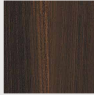
176 אקליפטוס מעושן